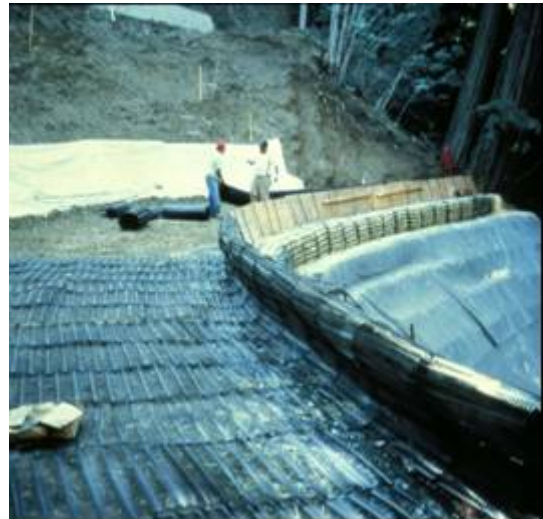
Exemple de réparation d'une pente par une structure de sol renforcée

Les couches de renforcement permettent de construire des pentes avec une inclinaison plus raide que les pentes non renforcées. Il peut être nécessaire de stabiliser la surface de la pente (particulièrement lors de la mise en place et du compactage du remblai) en utilisant des renforts secondaires relativement courts et moins espacés et (ou) en retournant les couches de renfort au parement. Dans la plupart des cas, la surface de la pente doit être protégée contre l'érosion. Cela peut exiger l'emploi de matériaux géosynthétiques retenant une fine couche de sol comme des géo-cellules ou des géo-mats relativement légers couramment utilisés pour ancrer temporairement la végétation. La figure ci-dessous montre qu'un drain peut être nécessaire pour éliminer les forces de sous pression dans le massif de sol renforcé.