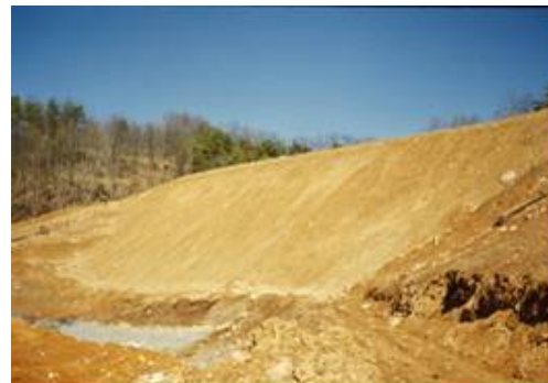
Remblai renforcé achevé